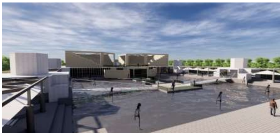
شکل (۴) رندر خارجی مجموعه فرشچیان

با ارزیابی سازگاری عملکردهای مجاور نشان می‌دهد که عملکردهای موجود باهمدیگر سازگار هستند و فقط دو فضای پارکینگ و کتابخانه بایستی در کنار فعالیت‌های دیگر تعبیه شوند همچنین فضای باشگاه بایستی افزایش پیدا کند.