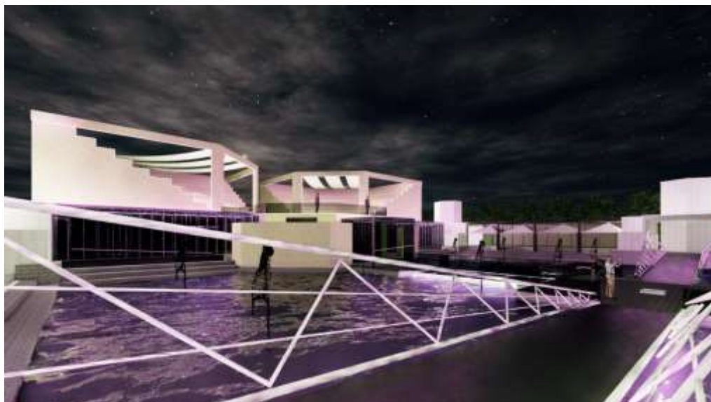
شکل (۵) رندر شب خارجی مجموعه فرشچیان