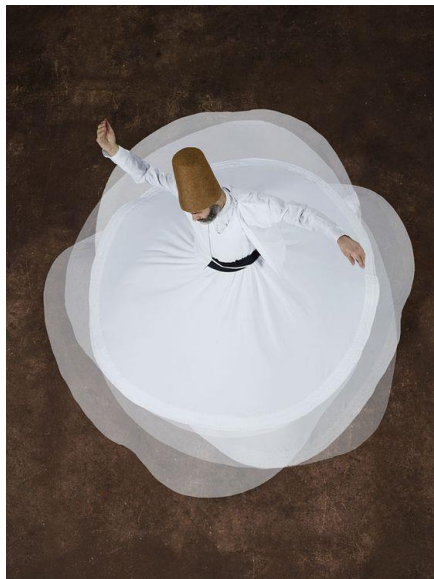
تصویر (۱) سماع مولانا

داشت در این پایکوبی زیر لگد خرد می کرد و راه تبتل تا فنا را در یک جست و خیز رمزی هر روز و شب بارها طی می کرد و خود را در تمام این حرکات مغلوب احوال گونه گون سلوک روحانی می دید. بدین گونه در طی سماع یارانش زمین و هر چه زمینی بود در زیر لگد ها خرد و له و پست و پیش پا افتاده می شد و هوا که دستها از ورای آن به آسمان می رسید در تموج و ارتعاش حرکات این دستها راه را برای عروج روح به ماورای جسم می گشود و هر چه جسم در طی این حرکات بیشتر خسته می شد روح بیشتر احساس سبکی و بی وزنی می کرد و بیشتر خود را آماده ی عروج می یافت. (ادبی. ۵۳. ۱۳۸۳)