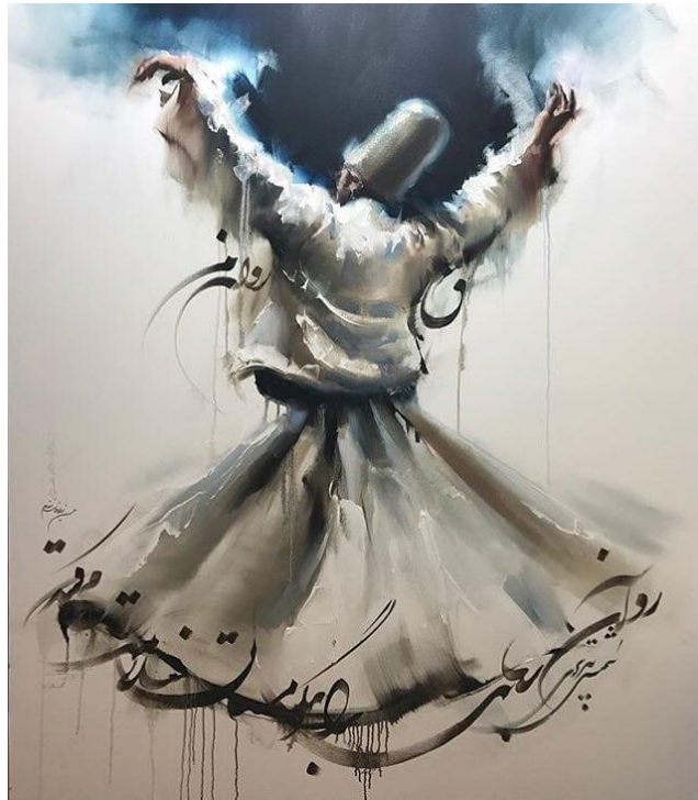
تصویر (۴) نقاشی میکس مدیا رقص سماع مولوی

در تصویر (۴) تابلوی هنری یک تقدم و یک تاخری وجود دارد یک فضای بالا یک فضای معنوی و آسمانی، درست همانطور که چشم بیننده از سطح زمین به سمت آسمان می‌رود رنگ‌ها و فرم‌ها بازتر می‌شود هر چه چشم بیننده به سطح زمین پایین قرار می‌گیرد به علت بافت خشن و تیره‌ای که دارد حالت استحکام به کار را می‌دهد بنابراین در این تصویر که سماع‌گر در حالت رقص است دامن و چین‌ها در فضا می‌گردد و این استحکام چین‌ها را در پایین کار با استفاده از خطوط مشکی استفاده کرده که این خط مشکی هم پای دامن و چین و چروک دامن گشته است مثل حرف نون که در پایین طوری استفاده شده که تصور میشود چینی از دامن است که به بالا رفته به خوبی از خطوط شکسته نستعلیق که همانند خطوط دکوراتیو استفاده شده و چون از رنگ سیاه در خطوط استفاده شده استحکام به سماع‌گر را داده است. اگر این خط روشن بود تصور میشد سماع‌گر در فضا است بنابراین برای اینکه چشم بیننده در چرخش باشد و خط مشکی تنها به چشم نخورد طراح آمده در دستان، یک حالت سیاه خورشید گونه که در این دنیای سیاهی طالب نور است و می‌رقصد و حقیقت را پیدا کند؛ و پایین کار به عنوان خطوط و بالای کار به عنوان یک لکه آبسترک، که توازن میان رنگها و خط‌ها است را ایجاد کرده است.