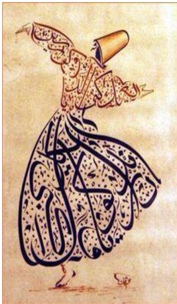
تصویر (۲) خط در سماع،