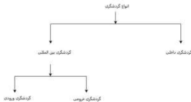
شکل شماره ۱: انواع گردشگری، [12]

اکنون صاحب نظران و سازمان‌های بین‌المللی با توجه به معیارهای مختلف، دسته‌بندی‌های متعددی از گردشگران ارائه کرده‌اند برای مثال می‌توان به گردشگری انبوه و جایگزین اشاره کرد گردشگری انبوه عبارت است از گردشگری معمولی که در سطح گسترده در سراسر جهان وجود دارد این نوع گردشگری کاملاً به صنعت گردشگری وابسته است. [12]