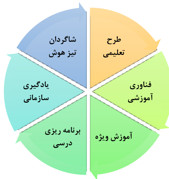
نمودار شماره ۱: از موضوعات مختلف شامل روانشناس تربیتی، [6].

برخی از موضوعات مختلفی که روانشناس تربیتی به آن‌ها تمایل دارند به شرح زیر می‌باشند: