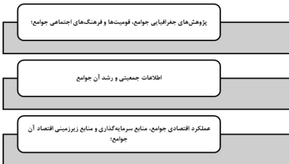
شکل ۳: پایه های رشد و توسعه فرهنگی، اجتماعی و اقتصادی و سیاسی