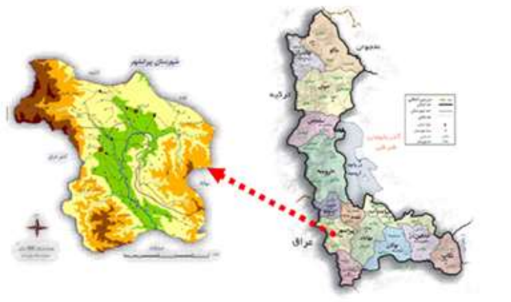
شکل ۱: موقعیت پیرانشهر در تقسیمات سیاسی کشور

میانگین بارندگی سالانه طی یک دوره ۳۰ ساله (۱۳۹۴-۱۳۶۴) در ایستگاه پیرانشهر معادل ۶۶۵ میلی‌متر بوده است، متوسط سالیانه درجه حرارت در این شهر طی یک دوره ۳۰ ساله آماری ۱۲/۴۵ درجه سانتی‌گراد محاسبه شده است. متوسط رطوبت نسبی سالانه در شهر پیرانشهر ۵۳/۶۸ درصد است که بیشترین میزان این شاخص مربوط به دی‌ماه با ۷۲/۷۳ درصد و کمترین آن با ۳۵/۶۶ درصد مربوط به ماه مرداد است. تعداد روزهای یخبندان در طول سال در شهر پیرانشهر ۹۶ روز است که از ۱ روز در فروردین‌ماه تا تمام‌روزهای ماه در دی‌ماه نوسان دارد و مجموعاً در ۶ ماه از سال از آبان تا اسفند و فروردین‌ماه پدیده یخبندان در شهر پیرانشهر اتفاق می‌افتد. جهت باد غالب، غرب و جنوب غرب بوده و بیش‌ترین میزان سرعت باد در بازه‌ی ۸/۸ تا ۱۱/۱ و در جهت جنوب غربی واقع است. این سرعت باد، قدرتی در حد تکان دادن شاخه‌های بزرگ دارد و به عنوان باد شدید، نام برده می‌شود.