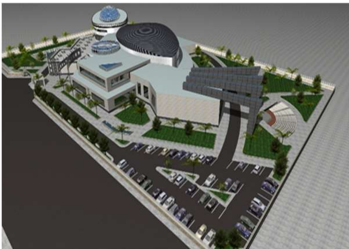
نقشه ۳: سه بعدی مجموعه فرهنگسرای شهدا در شهر پیرانشهر