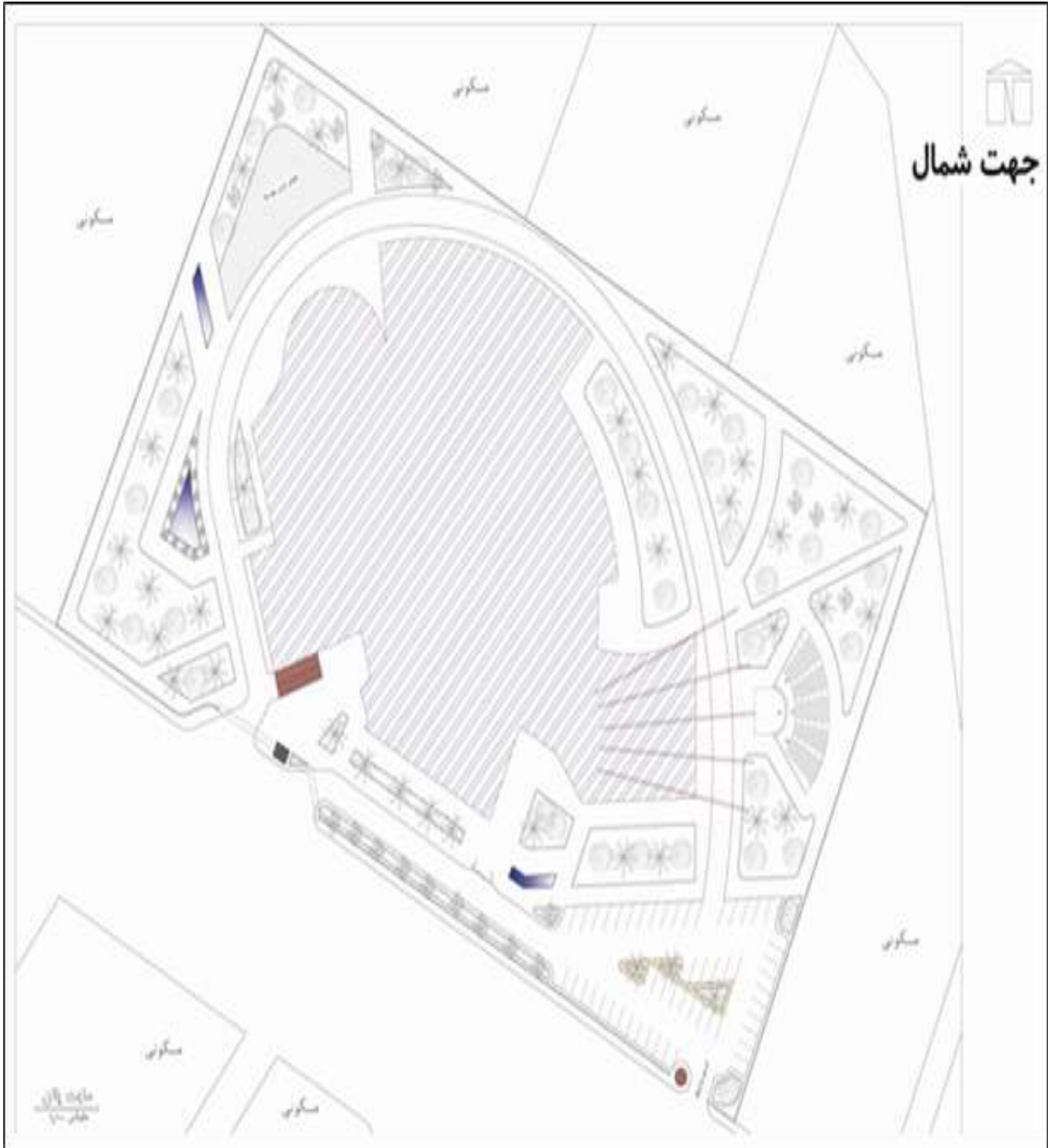
نقشه ۲: سایت پلان

هماهنگی با حرکت های بصری و ادراکی موجود در پلان ساختمان قرار دارد. به دلیل هم تراز بودن سطح زمین در محدوده ی سایت از ایجاد اختلاف ارتفاع در محوطه سازی پرهیز شده است.