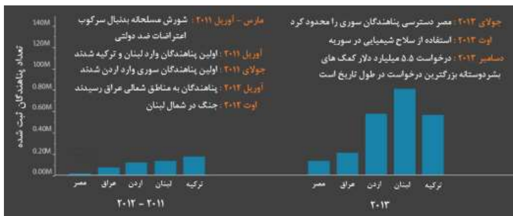
نمودار ۱: وقایع سالهای ۲۰۱۱ تا ۲۰۱۳ (اکاپس، ۲۰۱۵)

در نمودارهای ۱ و ۲ به ترتیب وقایع مهم و تعداد پناهندگانی که بصورت رسمی در کشورهای منطقه ثبت شده اند، نشان داده شده است.