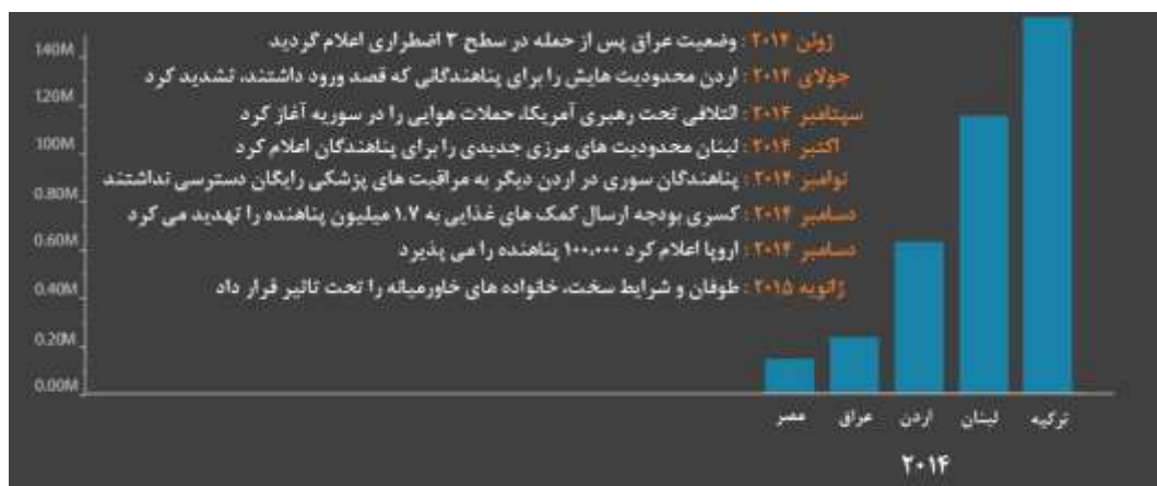
نمودار ۲: وقایع سال ۲۰۱۴ پناهندگان (اکاپس، ۲۰۱۵)