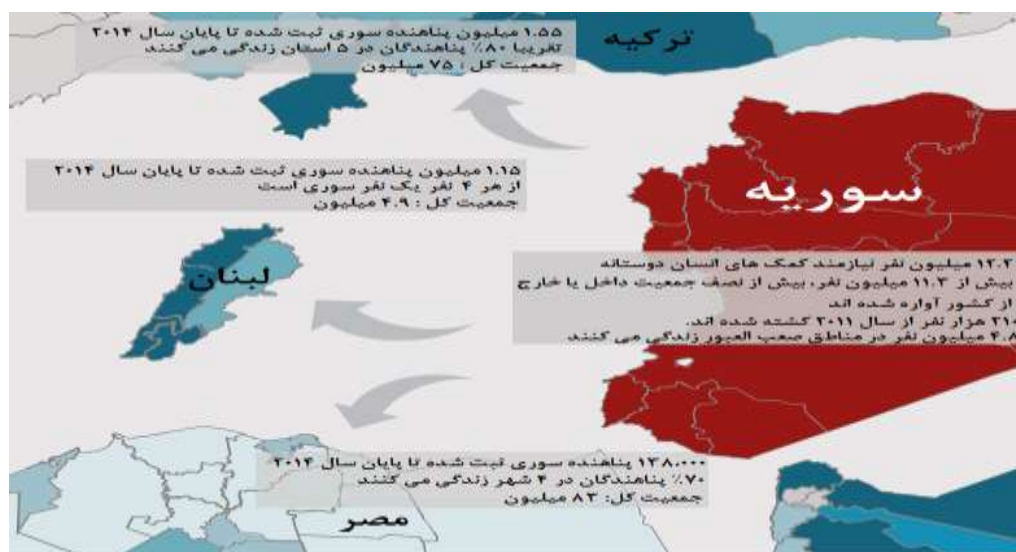
شکل ۱: وضعیت پناهندگان سوری در منطقه (آکاپس، ۲۰۱۵)

همانطور که در زیر توضیح داده شده است، کشورهایی که در حال حاضر میزبانی اکثریت قریب به اتفاق جریان پناهندگان سوریه را دارند دچار محدودیت در منابع خود شده‌اند. اردن، لبنان و مصر جمعیت بزرگی از پناهندگان را قبل از هجوم سوریه در خود جای داده‌اند. اگر نگوییم همه آنها، بسیاری از این گروه پناهندگان در شرایط بسیار سختی زندگی می‌کنند، و کشورهای میزبان نمی‌توانند تمام نیازهای پناهندگان را برآورده سازند. نرخ بیکاری لبنان و مصر دو رقمی است. اردن چهارمین کشور کم آب در جهان است، که آب آشامیدنی کافی برای مردم خود ندارد (بیدینگر، ۲۰۱۵)