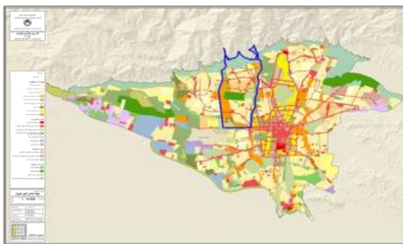
نقشه شماره ۱: موقعیت منطقه دو تهران

تحقیق حاضر در محدوده مکانی منطقه دو شهرداری شهر تهران انجام گرفته است. این منطقه جزء مناطق توسعه یافته در محدوده میانی و شمالی شهر تهران است که با مساحت تقریبی ۶۴ کیلومتر مربع وسعت تقریبی ۶۰ هزار نفر، دارای نه ناحیه شهری بوده و به محله منیری و ۳۰ محله شورایاری تقسیم شده است. از شمال به ارتفاعات البرز، از غرب به بزرگراه آیت الله اشرفی اصفهانی و منطقه پنج، از جنوب به خیابان آزادی و مناطق نه، ۱۰ و از شرق به بزرگراه چمران و مناطق سه، یک و شش محدود شده است.