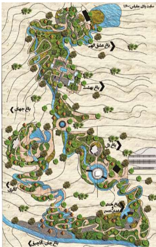
تصویر ۱۳: سلسله مراتب باغ های ذهنی مولوی در شیب کوهستان

در جدول زیر نگاه کلی به ویژگی های پیشنهادی طراحی باغ های ذهنی مولوی داریم: