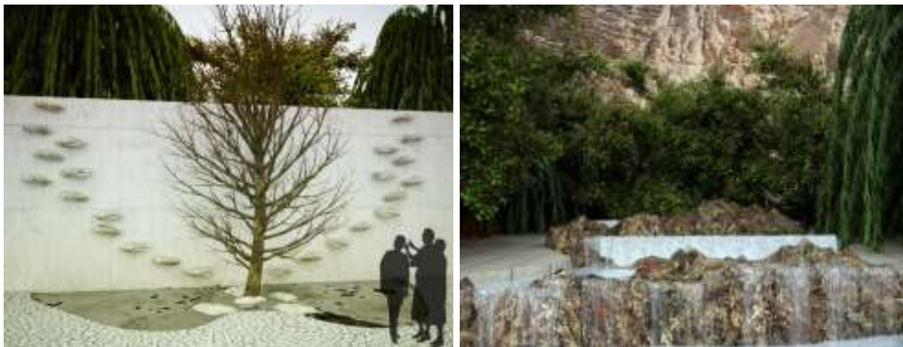
تصویر ۸: آب جاری یاد آور عمر و وقت- تصویر ۹: دیوار با پله های سنگی برای عروج به باغ بهشت از جهان خاکی

آب جاری: در نهر یا جوی برای بیننده یادآور عمر و وقت، زیبایی، لطافت، سرسبزی، قدرت و عشق الهی مسیر حرکتی: پر پیچ و خم استعاره از دنیا، ریاضت انسان برای رسیدن به باغ بهشت، تلاقی با مسیر باغ دل