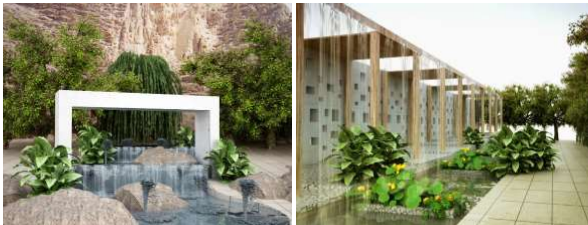
تصویر ۳: آب جاری در مسیر حرکتی، منبع: نگارنده تصویر ۴: آب جوشان، منبع: نگارنده