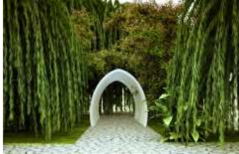
تصویر ۱۰: سردر باغ بهشت، جدایی از دنیای زمینی

آب: جاری شدن در چهار جهت مسیر حرکتی: صاف و بدون پیچ و خم استعاره از زندگی آرام در بهشت، تلاقی با مسیر آب