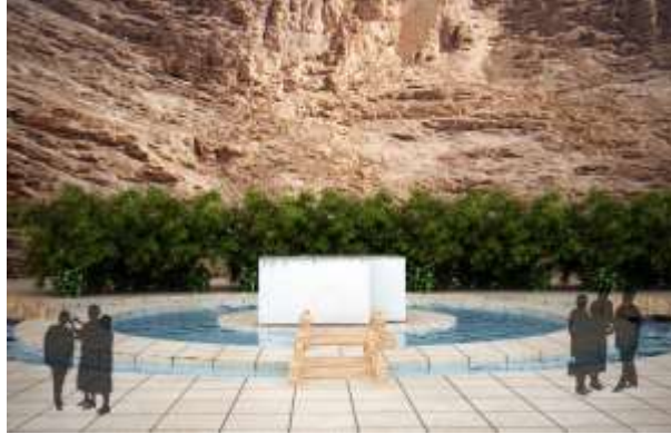
تصویر ۷: آب ساکن گرداگرد بنای مذهبی، حریم مقدس

مسیر حرکتی: در مسیرهای حرکتی باغ دل و باغ جهان برای رسیدن به باغ بهشت بر هم تلاقی می کنند.