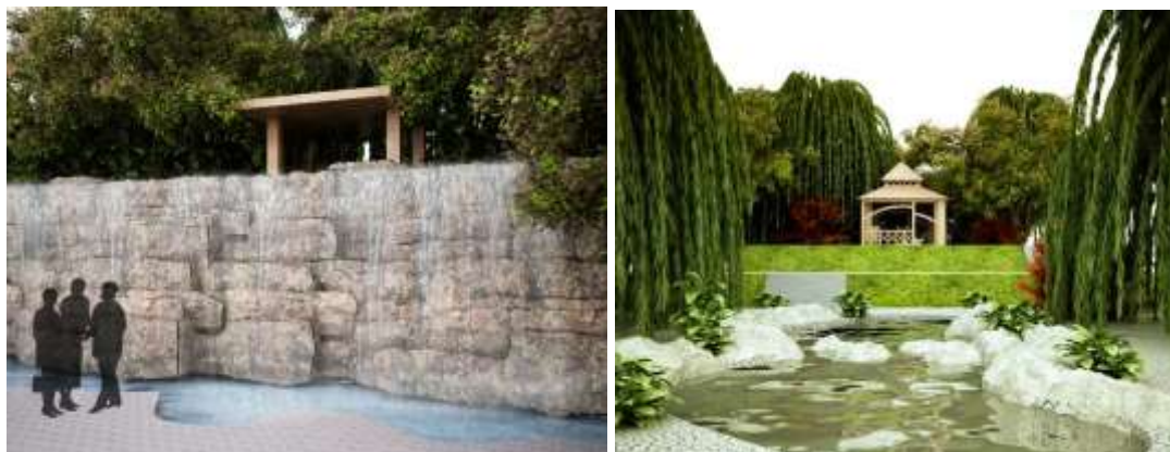
تصویر ۵: آلاچیق کنار رود تصویر ۶: تلاقی مسیر آب با مسیر حرکتی، منبع: نگارنده

مسیر: صاف و پر پیچ و خم، مسیرهای صاف برای آرامش روان انسان و مسیرهای پر پیچ و خم نماد دنیا. تلاقی با مسیر آب.