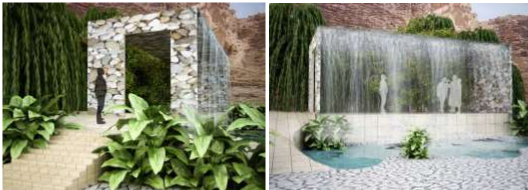
تصویر ۱۱: انسان از درون ابشار آبی که از بلندی به پستی میریزد را نظاره گر است، تصویر ۱۲: ورودی ابشار، منبع: نگارنده

سلسله مراتب باغ های ذهنی مولوی در شیب کوهستان: