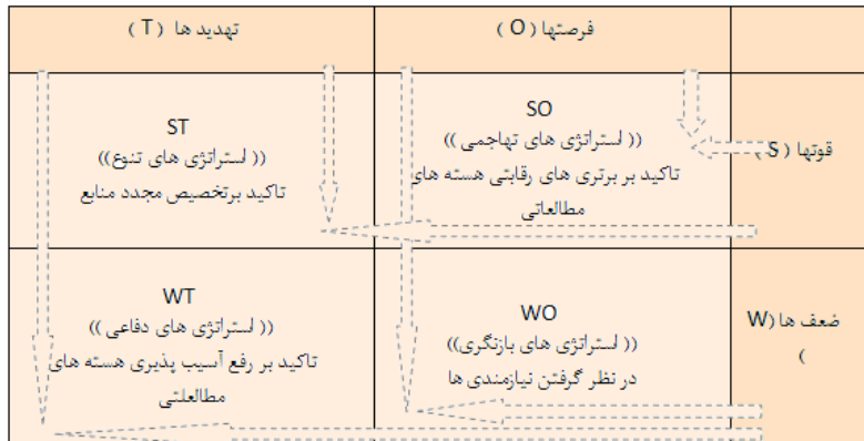
شکل ۳: مدل مفهومی روش شناسی ارزیابی عوامل داخلی و خارجی و تشخیص نوع استراتژی

○ استراتژی تدافعی یا انفعالی یا WT: برای به حداقل رساندن زیان‌های ناشی از تهدیدها و نقاط ضعف (شکل ۳).