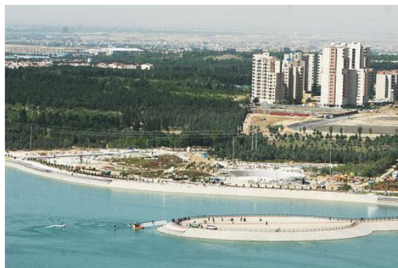
شکل 3- دریاچه شهدای خلیج فارس