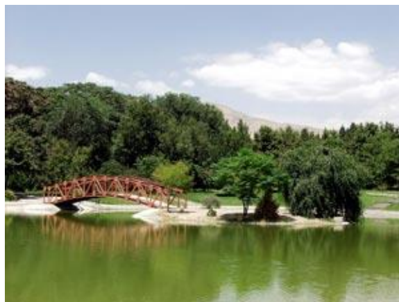
شکل 4- باغ موزه گیاهشناسی