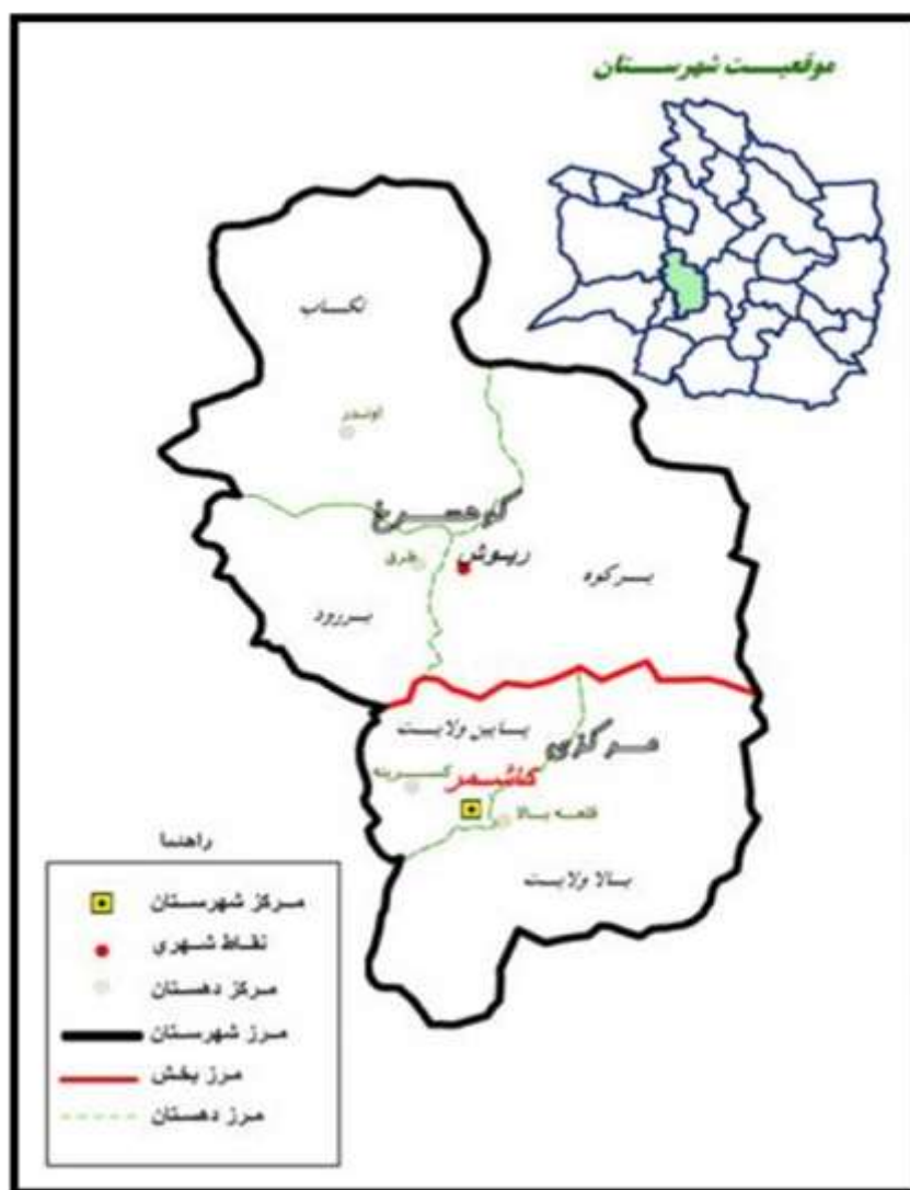
شکل شماره ۲. موقعیت روستاهای بخش مرکزی در شهرستان کاشمر