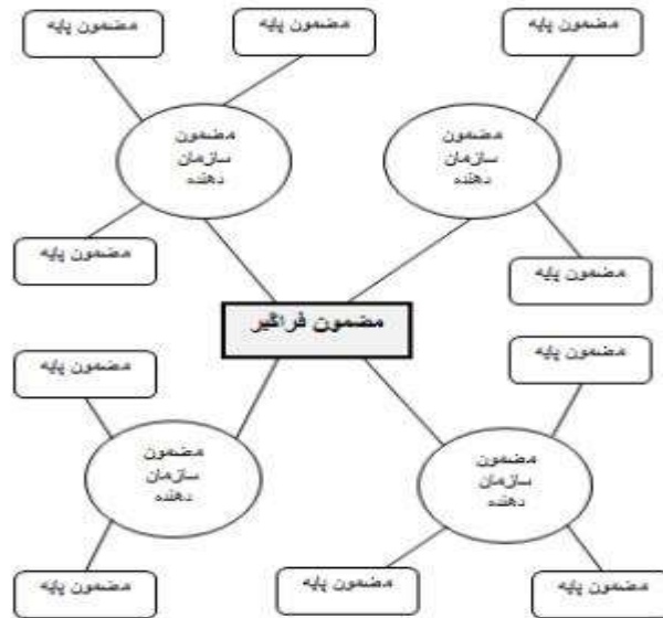
شکل ۱. ساختار یک شبکه مضامین (آترید و استیرلینگ، ۲۰۰۱: ۳۸۸)

به صورت ویژه این روش دارای سه شکل کد گذاری متوالی و وابسته به هم است که عبارتند از کد گذاری باز: یافتن مقولات مفهومی-کدگذاری محوری: شامل ارتباط بین مقوله ها- کد گذاری انتخابی: شامل مفهوم سازی ارتباط در سطح بالاتر. از این رو ابتدا بعد از کد گذاری کدهایی که دارای مفهوم مشابهی هستند دارای یه عنوان می شوند و سپس مولفه های حاصل که ارتباط نزدیک تری با هم دارند در قالب یه بعد در کد گذاری انتخابی مشخص می گردند.