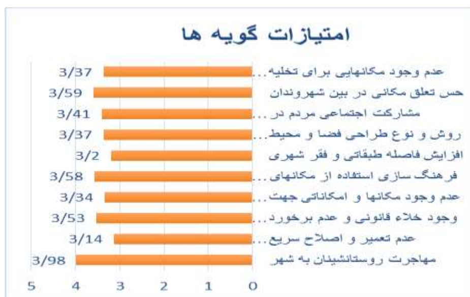
نمودار شماره یک - تاثیر و امتیازات گویه ها؛ منبع: نگارندگان ۱۳۹۴

در نمودار شماره یک میزان تاثیر هر کدام از گزینه ها و امتیاز هر کدام در قالب طیف لیکرت ارائه شده است.