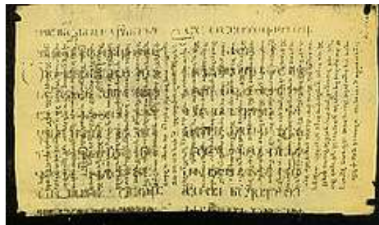
شکل ۲. نمونه از پالیمپست به صورت عمودی و افقی

یکی از مهم ترین مراحل تکوین تطهیر پول، مرحله لایه گذاری است. سرمایه با منشاء آلوده در همین مرحله لایه گذاری است که ماهیت اصلی آن میان لایه های متعدد و متعاقب پنهان می گردد و یا به فراموشی می رود. زمانی که تعدد لایه وجود داشته باشد، طبعاً لایه اولیه در میان سایر لایه ها مانند پالیمپست کم رنگ شده و به تدریج محو می گردد و این همان وضعیت مطلوبی است که گروه های پولشو برای نیل به آن تلاش می کنند. برای معرفی وضعیت مطلوب یادشده از مفاهیم "موقعیت تثبیت" و "ذات باوری" استفاده گردیده قطعاً موقعیت تثبیت و ذات باوری نوعی تقدم و تاخر دارد. به عبارت دیگر، نقطه تثبیت مرحله قبل از ذات باوری است بعلاوه این که موقعیت تثبیت بعد از مراحل جایگذاری و لایه گذاری قرار دارد ولی موقعیت ذات باوری و رسیدن به حس همزادپنداری با سرمایه کثیف بعد از مراحل ادغام و تثبیت رخ می دهد و در همین مرحله است که ایدئولوژی با قدرت تمام عیار خود از پذیرش منشاء غیر قانونی پول امتناع می کند. ناگفته نماند که در این تحقیق از قانون پایستگی انرژی ۱ که بر اساس آن مقدار انرژی در جسم همیشه ثابت است ولی ممکن است از نوعی به نوع دیگر و یا از صورتی به صورت دیگر تبدیل شود نیز استفاده گردیده.