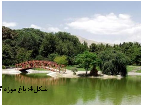
شکل 4: باغ موزه گیاه‌شناسی