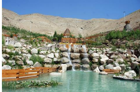
شکل 3: آبشار تهران واقع در منطقه 22 تهران